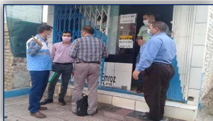
پلمب تعدادى از واحدهاى گروه دو، سه و چهار محدوديت هاى كرونايى در شهرستان گرمسار ۱۴۰۰/۰۲/۰۶