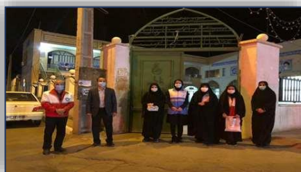
نظارت بر اجرای پروتکل های بهداشتی در مراسم شب قدر شهرستان آرادان ۱۴۰۰/۰۲/۱۵