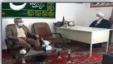
دیدار مدیر شبکه بهداشت و درمان شهرستان گرمسار با امام جمعه شهر ایوان کی ۱۴۰۰/۰۲/۲۵