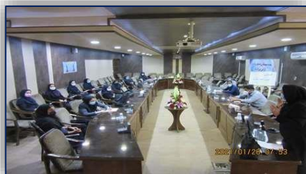
جلسه توجيهى تيمهاى واكسيناسيون كرونا در مركز بهداشت شهرستان سمنان برگزار شد ۱۴۰۰/۰۲/۰۴