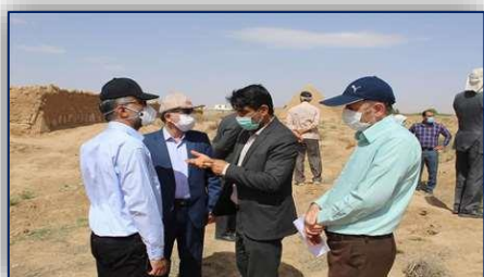
بازديد ميدانى فرماندار و مدير شبكه بهداشت و درمان دامغان از طرح مبارزه با مخزن سالك (جونده كشى) در روستاى عبدالله آباد ۱۴۰۰/۰۲/۰۱