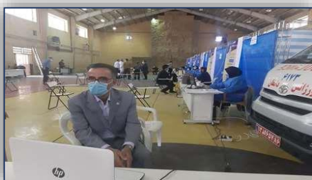
آیین افتتاح مرکز واکسیناسیون کووید-۱۹ شهرستان دامغان ۱۴۰۰/۰۲/۱۸