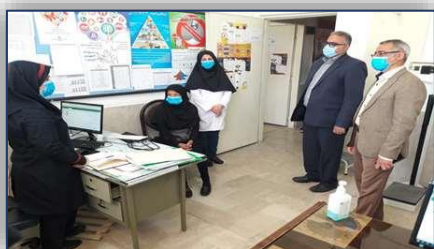
بازدید بخشدار شهر ایوان کی از مرکز واکسیناسیون کووید ۱۹ این شهر ۱۴۰۰/۰۲/۲۵