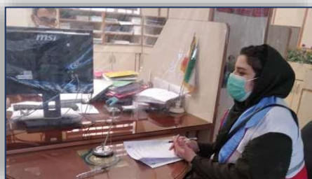
بازدید تیم نظارت بسیج و هلال احمر تحت پوشش شبکه بهداشت و درمان شهرستان گرمسار از اماکن عمومی ۱۴۰۰/۰۲/۱۵