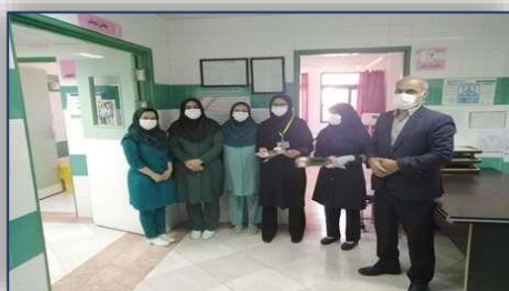
گرامیداشت روز جهانی ماما در بیمارستان ولایت شهرستان دامغان ۱۴۰۰/۰۲/۱۸