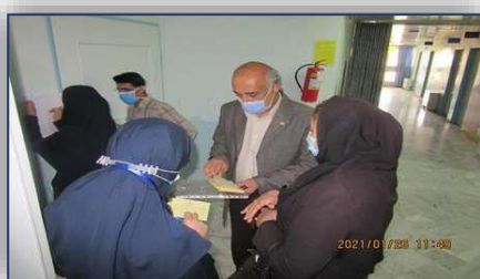
آموزش و بازديد از واحدهاى تزريق واكسن كرونا در بيمارستان هاى سمنان انجام شد ۱۴۰۰/۰۲/۰۴