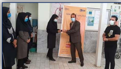
قدردانی سرپرست شبکه بهداشت و درمان آرادان از کارشناس بهداشت حرفه ای این شهرستان ۱۴۰۰/۰۲/۰۸