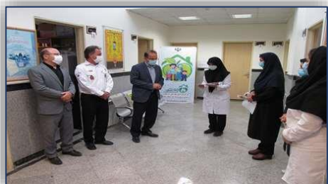
قدردانی از ماماهاى شاغل در شبکه بهداشت و درمان شهرستان آرادان ۱۴۰۰/۰۲/۱۸