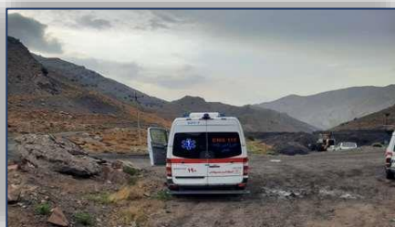
استقرار آمبولانس اورژانس پیش بیمارستانی شهرستان دامغان در صحنه حادثه ریش تونل معدن طزره ۱۴۰۰/۰۲/۱۸