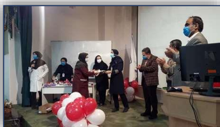
گرامیداشت روز جهانی کار و کارگر در مرکز آموزشی پژوهشی و درمانی امیرالمومنین (ع) سمنان ۱۴۰۰/۰۲/۱۱