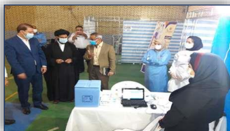
بازدید امام جمعه و فرماندار شهرستان گرمسار از مرکز واکسیناسیون کووید ۱۹ این شهرستان ۱۴۰۰/۰۲/۲۲