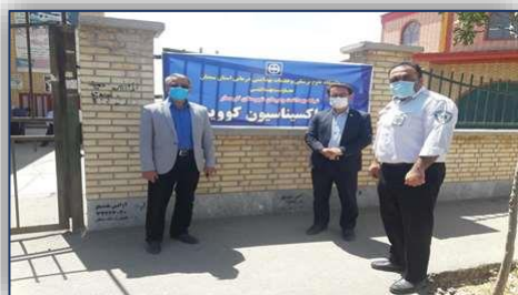
بازدید مدیر شبکه بهداشت و درمان شهرستان گرمسار از روند واکسیناسیون کووید ۱۹ ویژه گروه سنی ۸۰ سال به بالا ۱۴۰۰/۰۲/۲۰