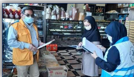
اقدامات نظارتی کارشناسان واحد بهداشت محیط شبکه بهداشت و درمان شهرستان گرمسار در راستای رعایت پروتکل‌های بهداشتی پیشگیری از شیوع کرونا ویروس ۱۴۰۰/۰۲/۲۵